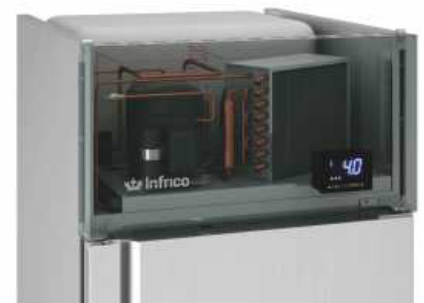
Sistema Monoblock para maximizar capacidad interior. Monoblock system to maximize internal capacity.